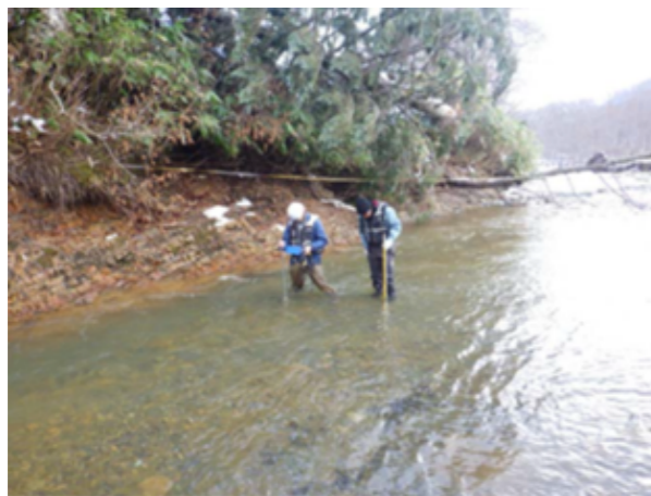
(現地流量測定(11 月時))