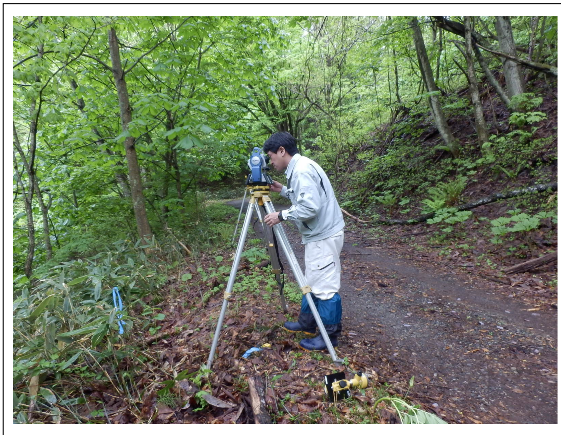
➤ 水圧管より発電所に至る、法面の地形測量作業