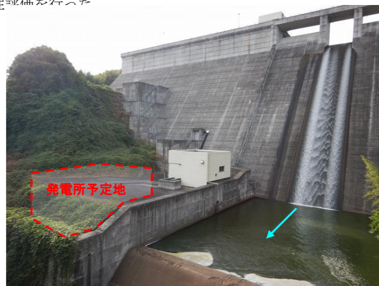
図 1. 調査地点の状況