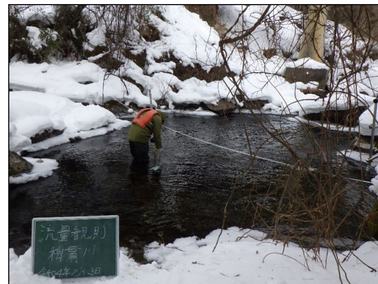
観測状況 令和4年2月3日