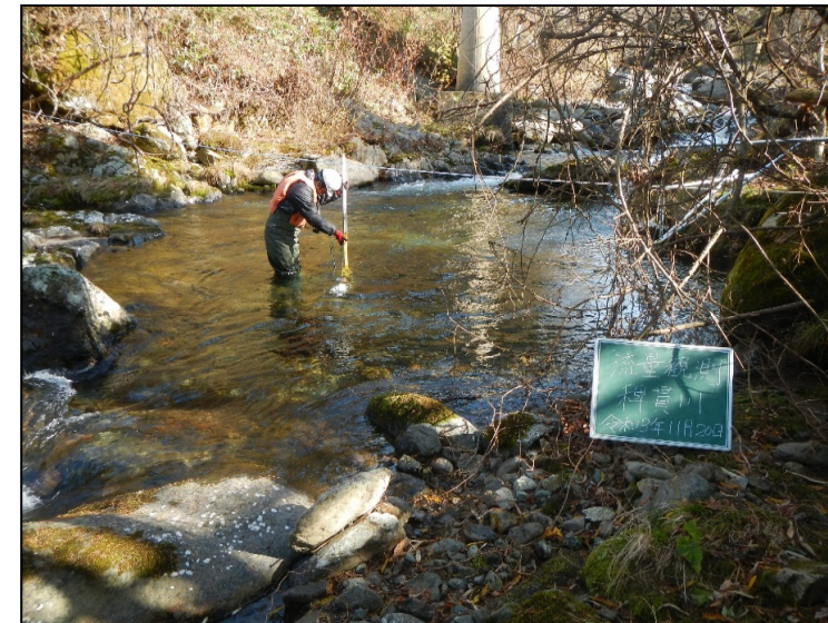
観測状況 令和3年11月20日