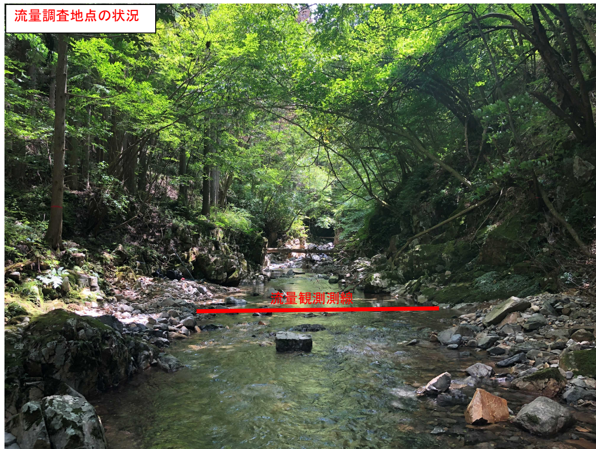
流量調査地点の状況

今後も継続して流量調査を実施し、蓄積したデータを用いて事業性評価の精度向上を目指す。